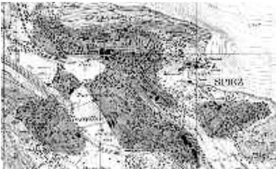
Möglicher Perimeter des Wärmeverbundes (dunkel eingefärbte Flächen)

Die Gesamtbelastung mit Verbrennungsabgasen wird deutlich reduziert. Anstelle vieler, kleiner Heizanlagen ohne Filter wird eine grosse mit entsprechenden Filteranlagen betrieben. Der die Klimaveränderung negativ beeinflussende Brennstoff Heizöl wird grösstenteils durch den klimaneutralen Brennstoff Holz ersetzt. Die angeschlossenen Wärmebezügler müssen sich nicht mehr um Brennstoffeinkauf, Service, Revisionen, Kaminfeger usw. kümmern und benötigen zudem keinen Raum mehr für das Brennstofflager.